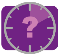
zmena vo vyprázňovacích návykoch