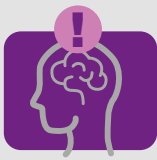
pocit únavy alebo slabosti